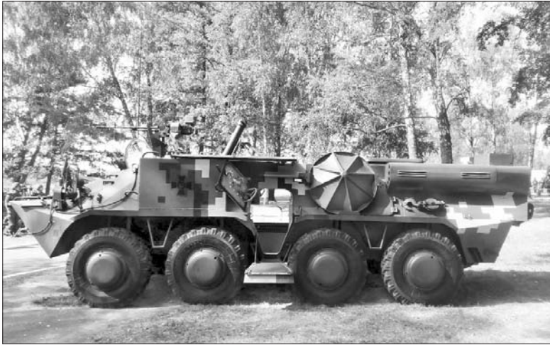
Самохідний 120 мм міномет з системою коригування вогню.